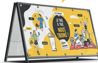
UNE BÂCHE DE COMMUNICATION