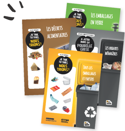
DES AFFICHES DE TRI

Vous êtes organisateur d'événements, vous souhaitez limiter les quantités de déchets produits au cours de votre manifestation, inciter au tri et favoriser leur recyclage... Profitez de notre kit événementiel.